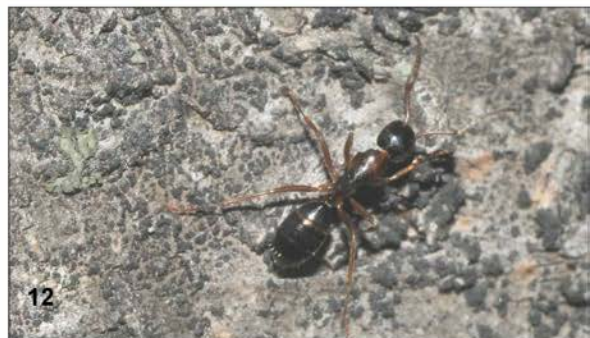
Abbildungen 6 - 11: Im Totholz und in Stängeln nistende Hymenoptera; Wien, Steinhofgründe, 7. Juni 2008; Fotos: 6 - 10, 12: H. Wiesbauer, 11: D.M. Sorger: (6) Osmia leaiana (Apidae); (7) Osmia leaiana (Apidae); (8) Anthidium scapulare (Apidae); (9) Chrysura radians (Chrysididae), (10) Agenioideus cinc-tellus (Pompilidae); (11) Camponotus vagus (Formicidae); (12) Camponotus fallax (Formicidae).