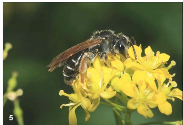
Abbildungen 2 - 5: Oligo- und monolektische Andrena -Arten (Apidae); Wien, Steinhofgründe, 7. Juni 2008; (2) Andrena hattorfiana , Weibchen, auf Acker-Witwenblume ( Knautia arvensis ); (3) A. curvungula , Weibchen, auf Glockenblume ( Campanula sp.); (4) A. florea , Männchen, auf Rotbeeriger Zaunrübe ( Bryonia dioica ); (5) A. lathyri auf Wild-Sumpfkresse ( Rorippa sylvestris ).